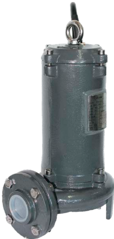
Tableau de protection en version monophasée. Dispositif de broyage, turbine en fonte. Axe en acier inoxydable (AISI 416). Moteur à bain d'huile de la classe F, 10 m de câble d'alimentation. Joint et garniture mécanique (oxyde d'aluminium - carbone - graphite).